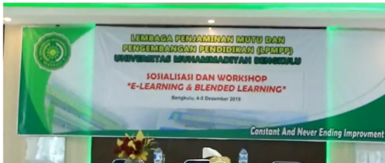
Gambar 2. Persiapan Pembukaan Kegiatan