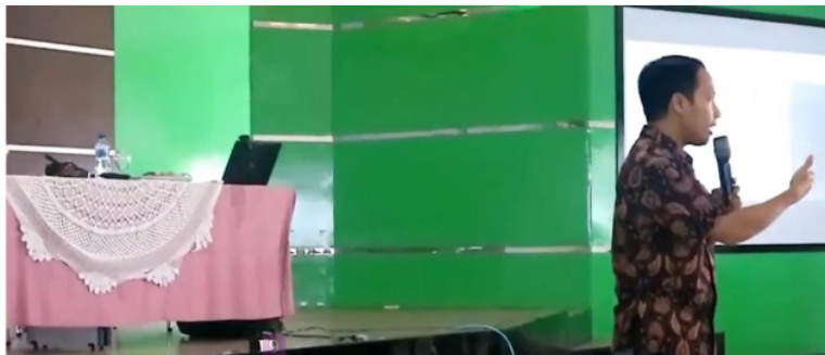
Gambar 3. Pemaparan Materi 1