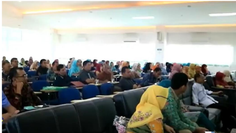
Gambar 6. Peserta Kegiatan 2