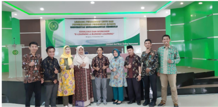
Gambar 8. Foto Bersama 1