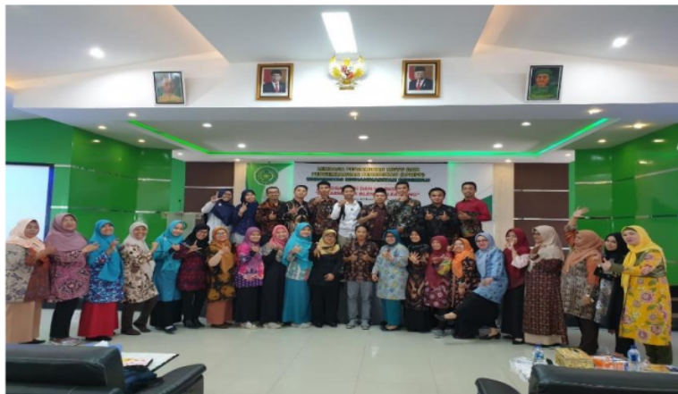
Gambar 9. Foto Bersama 2

Workshop tentang pembelajaran berbasis Model Blended Learning yang diadakan di UMB dapat dijadikan salah satu alternatif dalam upaya peningkatan proses belajar mengajar menjadi lebih aktif dan menyesuaikan perkembangan jaman di era Revolusi Industri 4.0. Hal ini didukung dengan pembelajaran