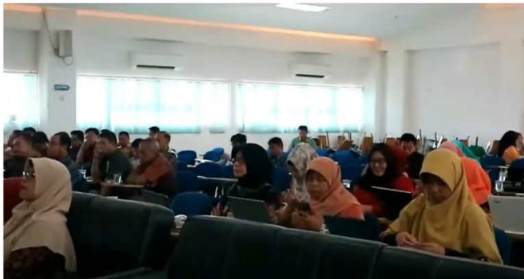
Gambar 5. Peserta Kegiatan Workshop 1