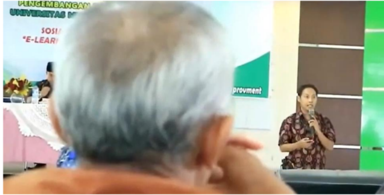
Gambar 4. Pemaparan Materi Blended learning