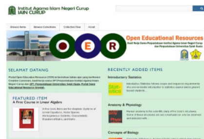
Gambar 1. Laman OER Perpustakaan IAIN Curup

Peneliti setelah melakukan kajian pustaka, pengumpulan data, dan analisis, kemudian melakukan Focus group Discussion (FGD) . Peneliti dalam FGD melibatkan tim Teknologi Pangkalan Data (TIPD) IAIN Curup, yaitu Unit Teknologi Informasi dan seluruh Pustakawan IAIN Curup, membahas strategi pengelolaan OER dan pemilihan software . Hasil FGD sepakat bahwa pengelolaan sumber pembelajaran terbuka di IAIN Curup menggunakan aplikasi Omeka . Aplikasi ini memungkinkan sebuah perpustakaan mengembangkan pengelolaan OER sesuai kebutuhan masing-masing perpustakaan. Aplikasi OER Perpustakaan IAIN Curup dapat diakses melalui website di alamat http://oer.iaincurup.ac.id . Hadirnya platform open source di setiap perpustakaan dapat menambah fitur tertentu, seperti fitur pencarian, statistik pemakaian, dan lain-lain.